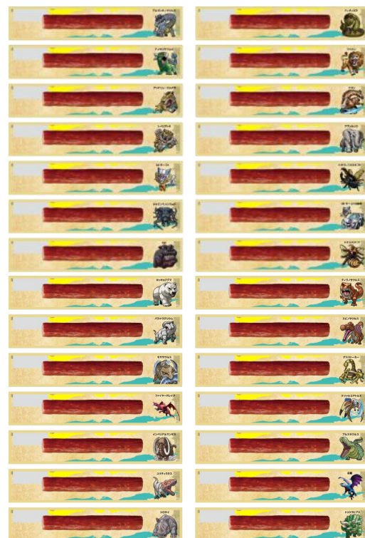
個包装デザイン全28種類