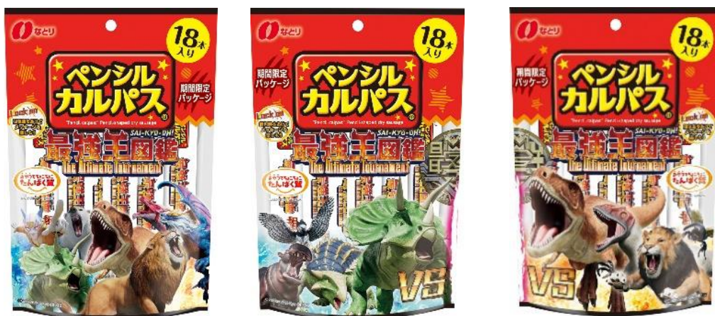
パッケージデザイン全3種類

株式会社なとり(本社:東京都北区、会長兼社長:名取三郎)は、「18本 ペンシルカルパス® 最強王図鑑 コラボパッケージ」を2月上旬より期間限定で新たに発売いたします。