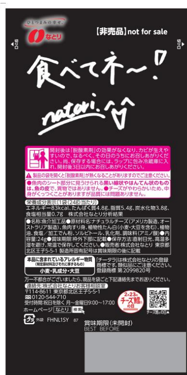
裏面(『なとり』のサイン入り)